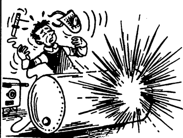
Fig. 1. Ontploffing als gevolg van een onvolledige « ontgassing ».